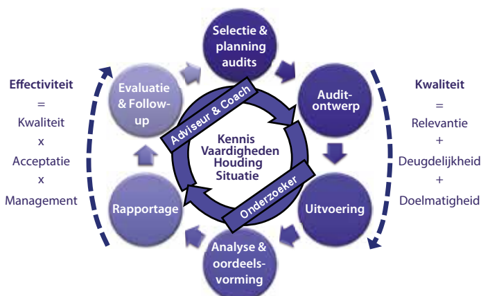
Figuur 1. Rollen en competenties in relatie tot het auditproces

en andere betrokkenen hierbij, bijvoorbeeld door het faciliteren van self assessments en het adviseren over mogelijkheden en timing. Een vergelijkbare rolvervulling is nodig bij het ontwerp van een ingeplande audit: wat is daarvoor de exacte kennisbehoefte en wat is een toepasselijke optiek en norm? Vervolgens verschuift het accent naar de rol van onderzoeker. De auditor vertaalt de geïnventariseerde kennisbehoefte naar een daarop aansluitend conceptueel ontwerp, auditmethode (technisch ontwerp) en organisatie (auditbeheersing). In de uitvoeringsfase gaat het om het daadwerkelijk verzamelen van de gegevens en om het managen van zich voordoende wijzigingen en issues. Ook het verwerken, analyseren en beoordelen van de verzamelde gegevens vraagt vooral een onderzoekende rol. De auditor geeft daarmee op een methodologisch verantwoorde manier antwoord op de onderzoeksvragen en verwerkt de resultaten in een rapportage die voorziet in de informatiebehoefte van de afnemers. Daarmee levert de audi-